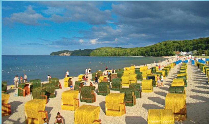
Schnell mal ans Meer: An der 1.700 Kilometer langen Küste von Vorpommern kein Problem.