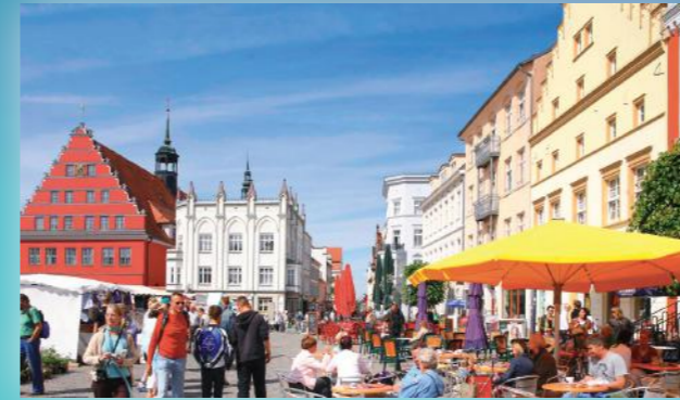
La Dolce Vita: Nach einem Stadtbummel die Sonne genießen. Auf dem Marktplatz in Greifswald laden zahlreiche Cafés und Restaurants zum Verweilen ein.

Handwerk und Industrie in Vorpommern bieten Berufseinsteigern vielfältige Möglichkeiten.