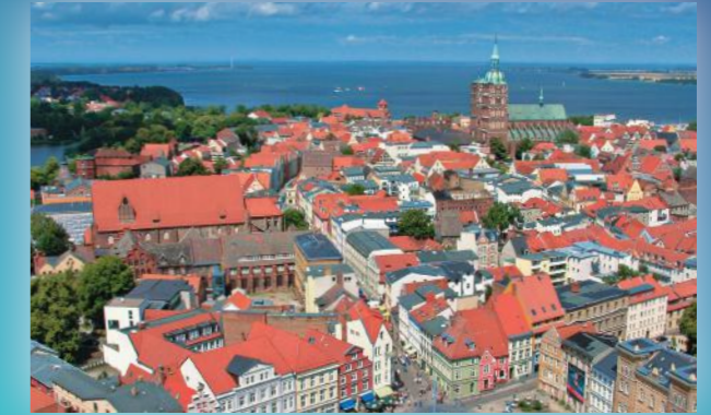
Mittelalter und Moderne: In der UNESCO-Welterbestadt Stralsund leben und feiern viele Studenten.