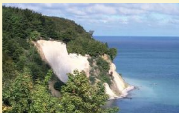
Touristen-Magnet: Die Kreidefelsen auf der Insel Rügen.

Nirgendwo in Deutschland scheint die Sonne so viel wie in Vorpommern, nämlich durchschnittlich über 2.000 Stunden im Jahr. Die Urlaubsinseln Rügen und Usedom sowie die Halbinsel Fischland-Darß-Zingst mit ihren endlosen Sandstränden, weißen Ostseebädern, mondänen Strandpromenaden und Naturschutzgebieten liegen direkt vor der Haustür. Sie bieten ideale Bedingungen für Windsurfen, Kiten, Segeln, Baden oder Beachvolleyball. Auch Radler, Reiter und Kanuten kommen hier voll auf ihre Kosten. Coole Partys versprechen Großdiskotheken und Bars, zahlreiche Clubs der Hochschulstädte Greifswald und Stralsund sowie manche Strände. Hinter den historischen Mauern der Hansestädte laden Boutiquen, Einkaufspassagen, Cafés und Restaurants zum Shoppen und Verweilen ein. Mit dem Ozeaneum in Stralsund, dem Nationalparkzentrum Königsstuhl und dem Pommerschen Landesmuseum in Greifswald verfügt die Region über drei Besuchereinrichtungen von internationalem Format.