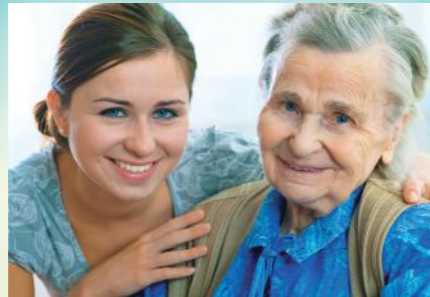
Pflegerische und therapeutische Berufe stehen hoch im Kurs.

Wer in der Gesundheitsbranche frisch durchstarten möchte, kann in Greifswald beispielsweise eine dreijährige Ausbildung zur Gesundheits- und Krankenpflegefachkraft absolvieren. Die zahlreichen Krankenhäuser, Facharztpraxen, Gesundheitszentren und Pflegeheime der Region versprechen gute Chancen für Berufseinsteiger.