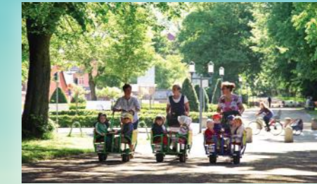
Gute Kinderbetreuung und viel Natur machen Vorpommern für Familien attraktiv.